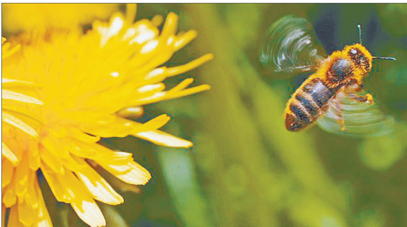
Bienen- und Wespenstiche sind gefährlich, wenn Menschen darauf allergisch reagieren. Todesfälle sind nicht selten.